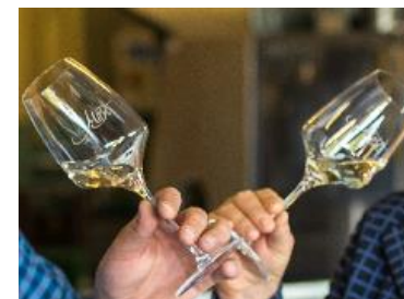
Qualitätsmoststielglas 0,25 l