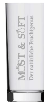
Longdrinkglas Most & Saft 0,5 l