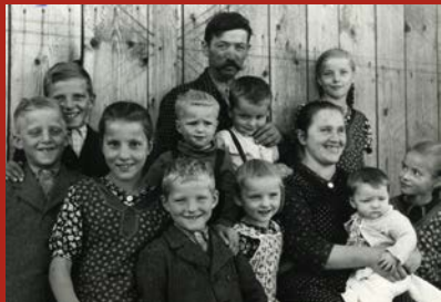
Abb. Cover (Ausschnitt) und Innenseite: Kinderreiche Familie in der Zwischenkriegszeit Innenseite: Spielzeug-Bär, bekleidet, 1930er Jahre

Most- und Wein-Verkostung von W2) Wurm & Wurm St. Florian